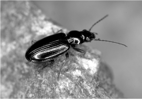
Abb. 1: Der Ahlenläufer Bembidion deletum ist die stetigste Art der untersuchten Wühl- und Suhlstellen von Wildschweinen.

chend starken Wildschweinspuren zeigten. Weitere Informationen über Zeitpunkt, Stetigkeit und Dauer der Nutzung durch Wildschweine liegen nicht vor. Boden-, Vegetations- oder Strukturparameter wurden an den Sammelstellen nicht erhoben.